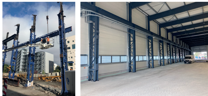
Exemple du démontage de poteaux acier sur un site Alstom et de leur ré-emploi sur le site industriel du Groupe Briand.

Précisons enfin que ce référentiel donne également des recommandations relatives au diagnostic initial, à la déconstruction, comme à la traçabilité d'un élément de réemploi.